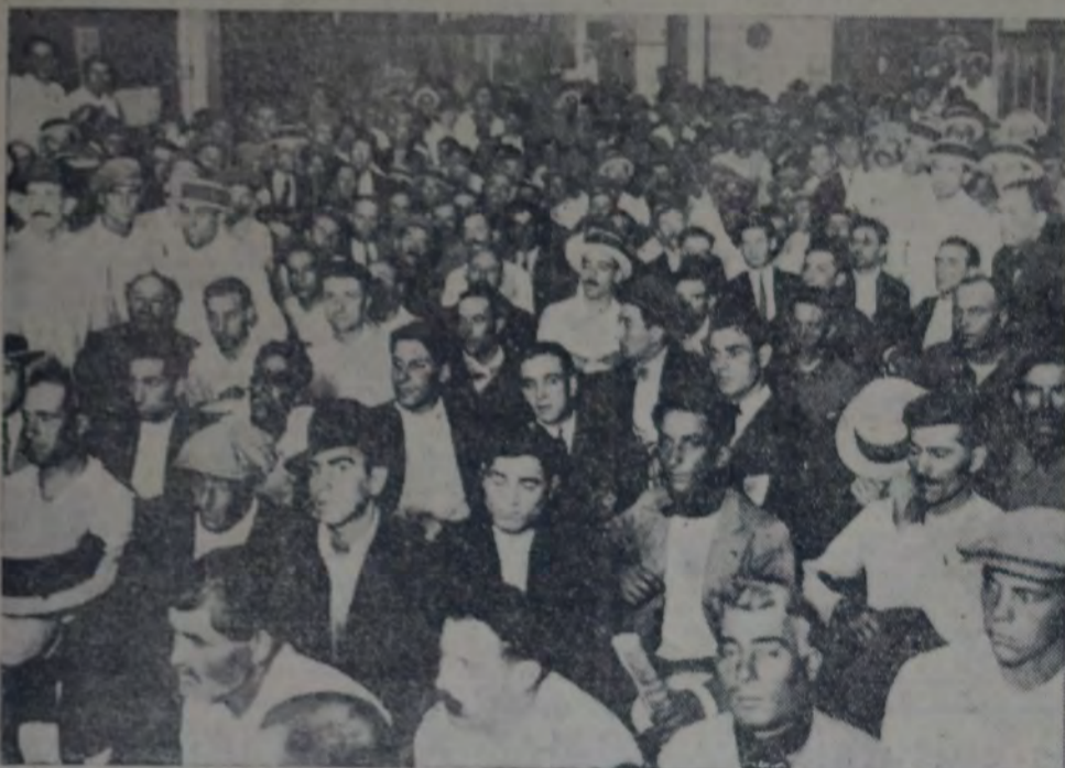
UNA VISTA DE LA ASAMBLEA REALIZADA AYER POR LOS ASERRADORES Y CARPINTEROS DE BOCA Y BARRACAS

Seguidamente se pasó a votar la propuesta por la C. A. y se aprobó por unanimidad en medio de las mejores muestras de entusiasmo. Resolviéndose después reunirse hoy de nuevo en el mismo local a las 8 horas. Casas que aceptan el pliego de condiciones. Han firmado el pliego de condiciones las casas Cristin, Figueras, Spinetto y Jorge Bell.